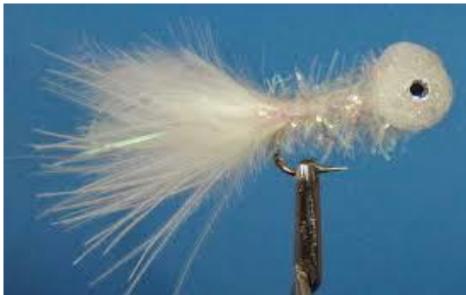
Alevin Boobie blanc