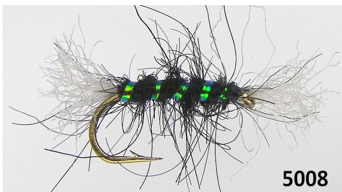
Shipman: gris olive ou noir